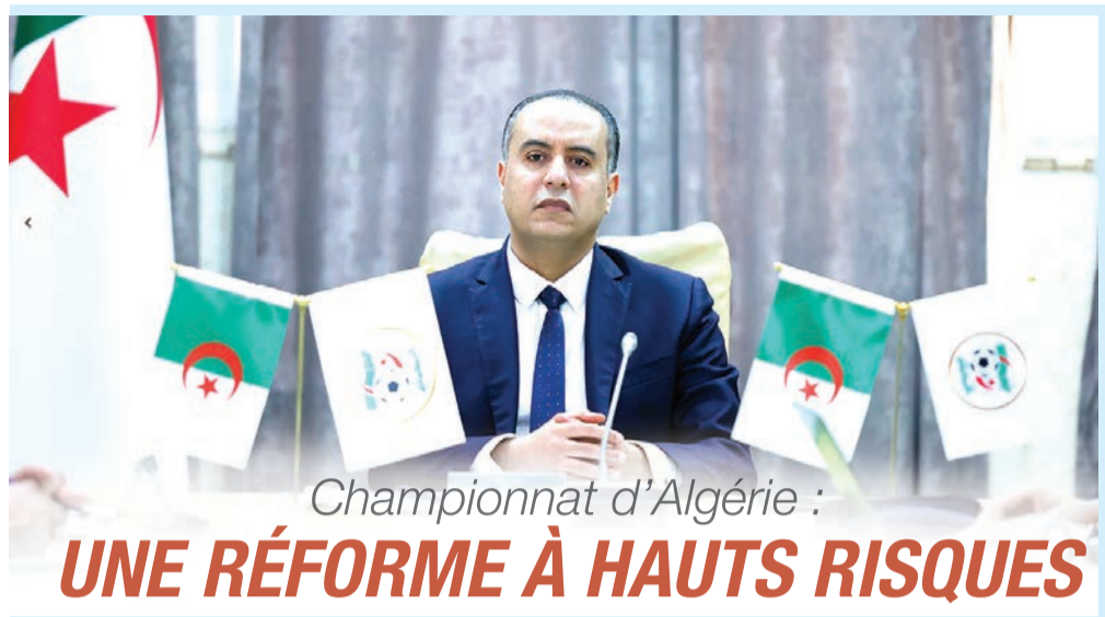
Championnat d'Algérie :