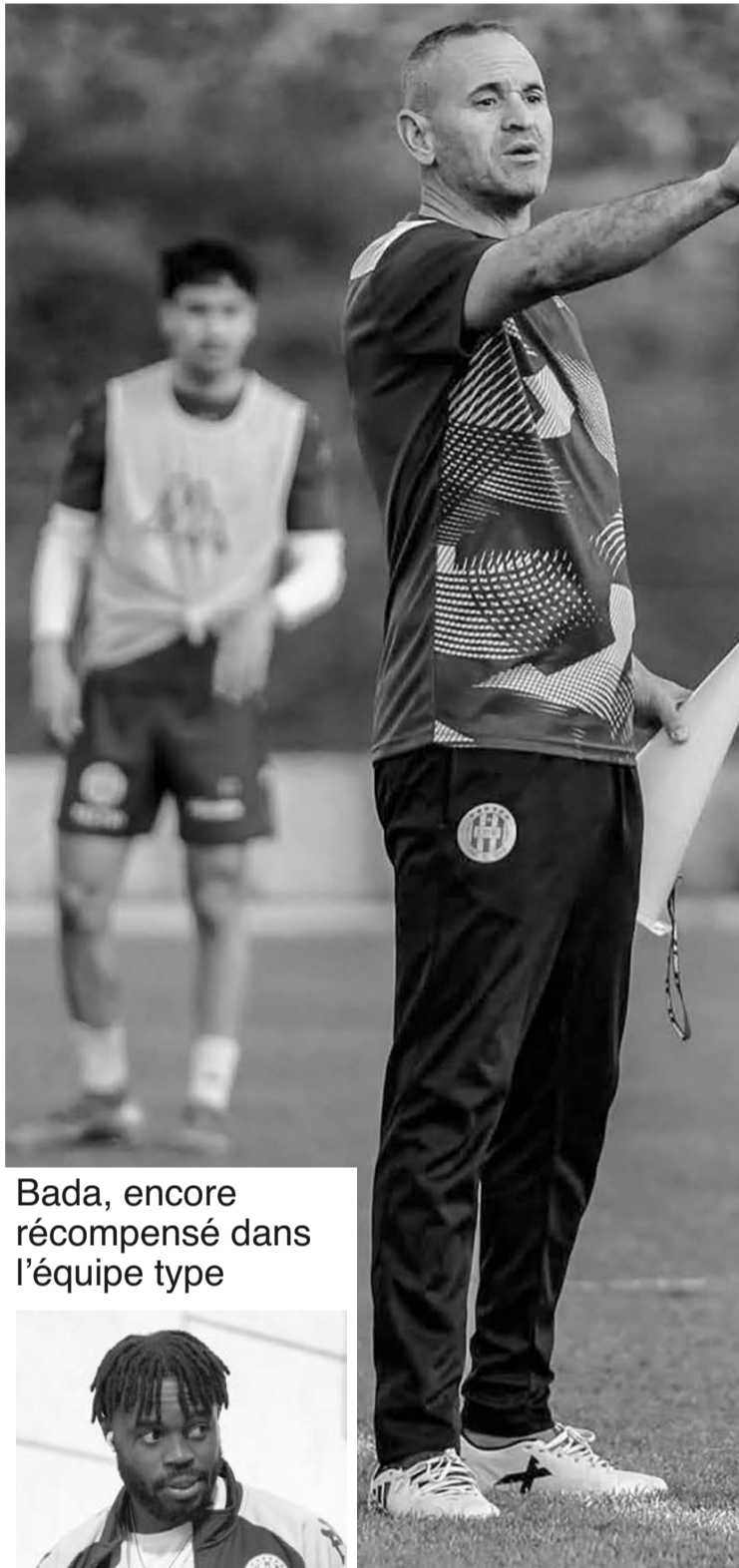
Bada, encore récompensé dans l'équipe type