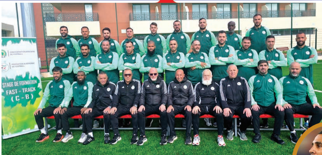
Fast-Track à Tlemcen

La ville des Roses a vécu des scènes de liesse exceptionnelles dans la nuit du lundi à mardi, après l'accession de l'USM Blida en championnat national amateur 2. Cet exploit tant attendu a déclenché une immense vague de joie dans les rues et les places de la ville, où les supporters ont célébré ce retour au premier plan avec enthousiasme et fierté. Cette montée récompense une saison de travail, de patience et de persévérance, portées par les joueurs, le staff technique et la direction du club, déterminés à ramener l'équipe à son véritable rang. Au-delà du simple résultat sportif, ce succès marque un tournant symbolique pour un club historique, rappelant que Blida demeure une terre de football et un vivier de talents capable de renaître après des périodes difficiles.